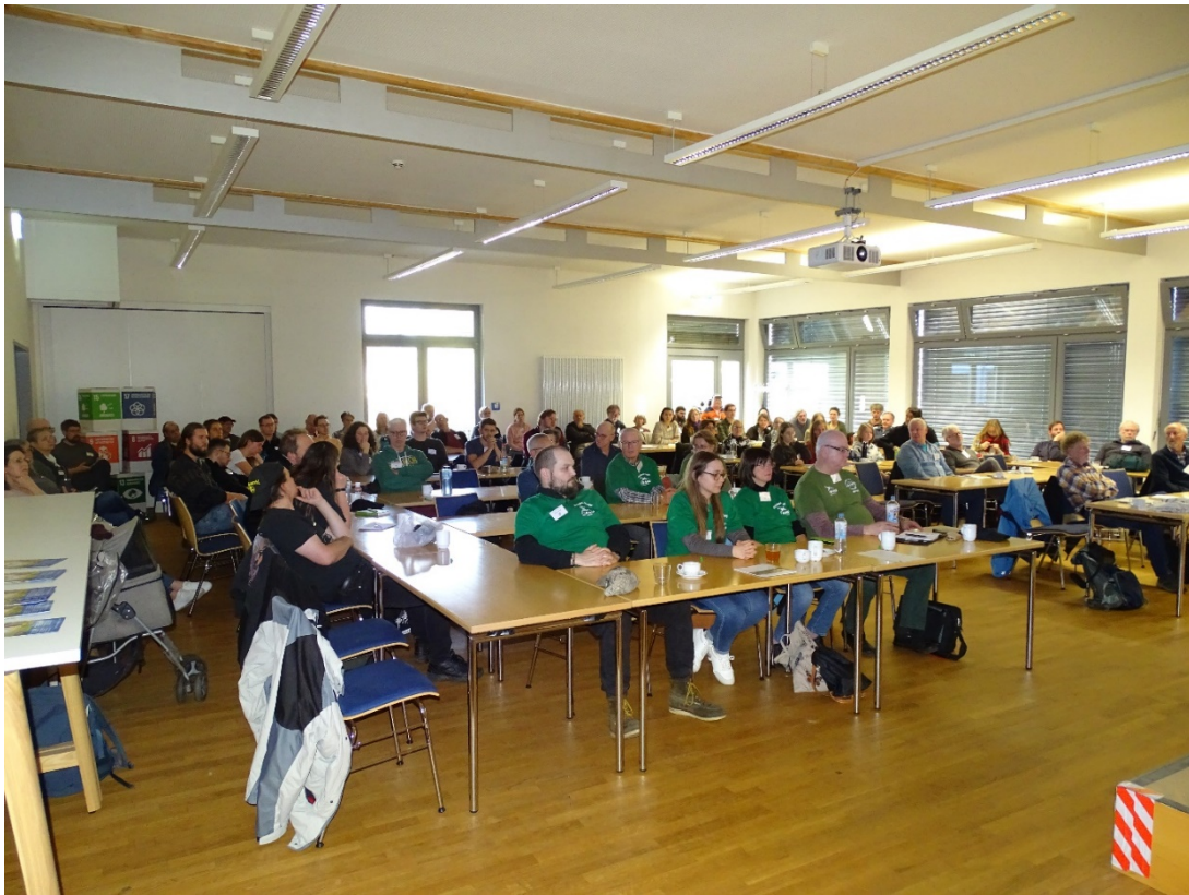
Abb. 4: Bestens besucht: unsere Jahrestagung am 03.11.2024 in der Natur- und Umweltakademie in Recklinghausen.