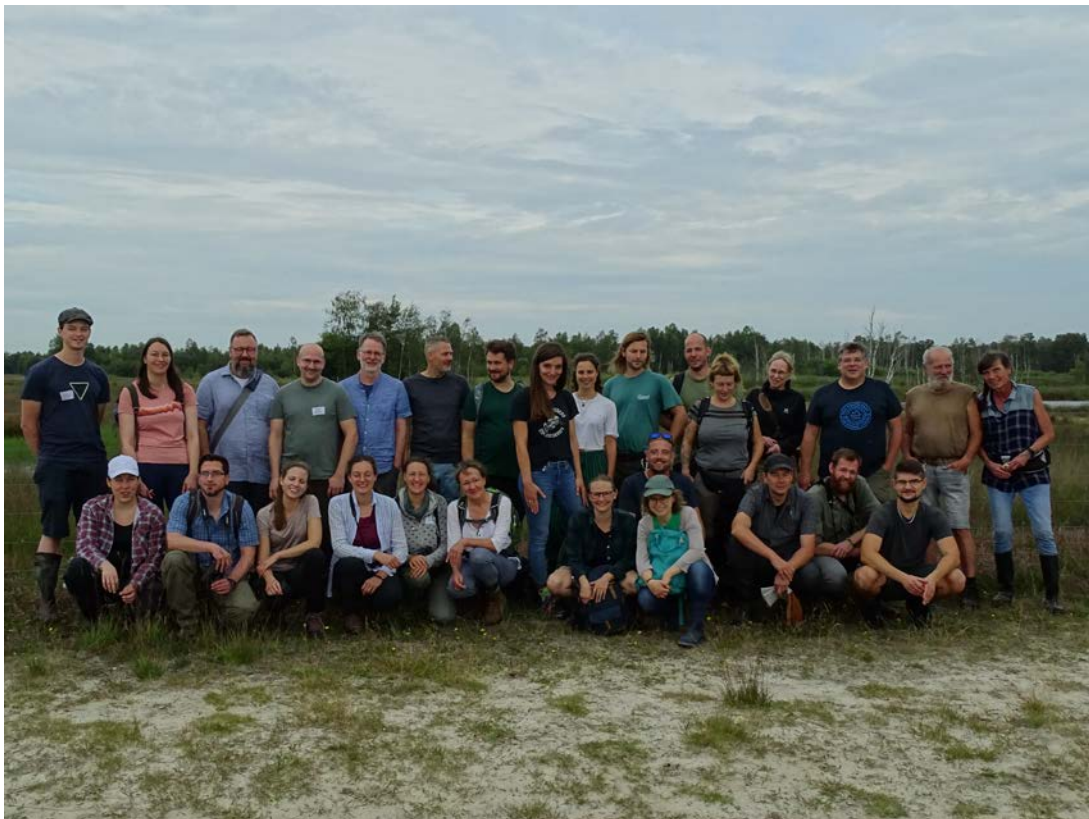
Abb. 3: Der Reptilienkurs am 19.08.2023 auf einer Exkursion.

LWL-Museum in Zusammenarbeit mit dem Arbeitskreis Amphibien und Reptilien NRW angebotene Programm bereits elf Kurstage.